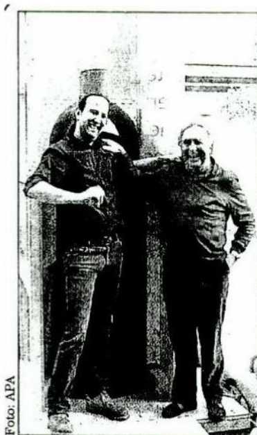
Reif fürs Guinness-Buch?